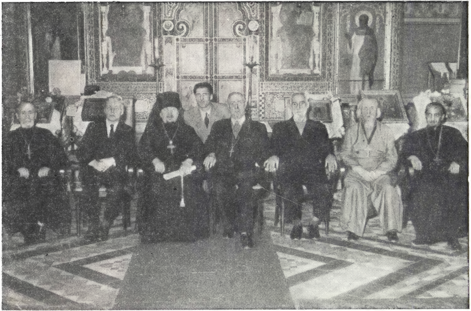
НА ДУХОВНОМ КОНЦЕРТЕ В ВЕНЕ

среди которых, как это всегда бывает в Вене, немало высококвалифицированных ценителей и постоянных посетителей многочисленных вечеров вокального искусства. Свободное от инструментально-звуковых эффектов католического церковно-хорового пения, но в то же время проникнутое глубоким лиризмом и высотой молитвенного настроения, церковное пение нашей Православной Церкви, как и все наше Богослужение, всегда привлекает к себе исключительное внимание и интерес со стороны молящихся христиан Запада.